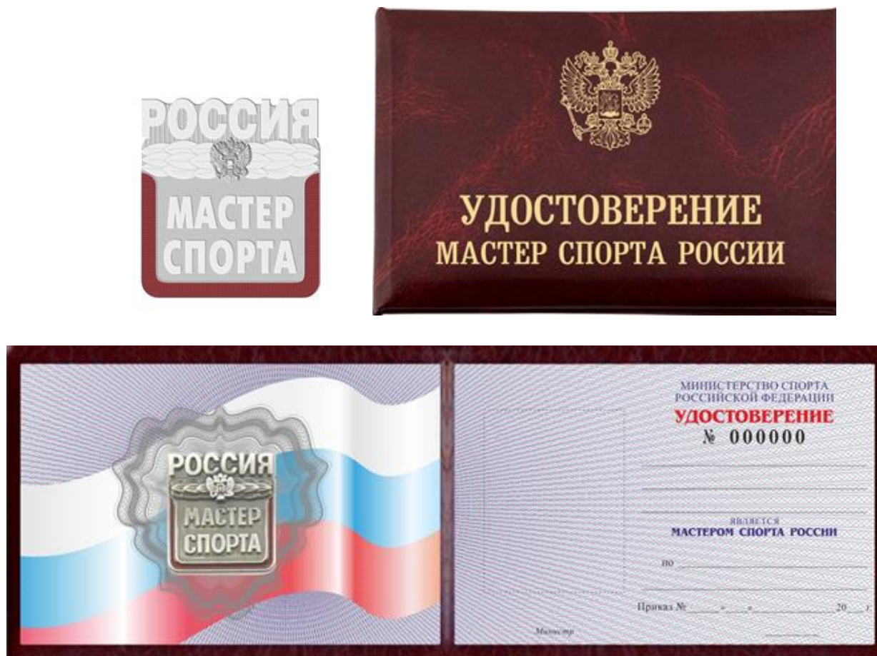
Рис. 4. Нагрудный знак «мастер спорта России» и удостоверение «мастер спорта России»

В случае подачи документов для присвоения спортивного звания, не соответствующих требованиям Положения о ЕВСК (п. 31, 33), Минспорта России в течение 20 рабочих дней со дня их поступления от УФПиС ВС РФ возвращает их в УФПиС ВС РФ с указанием причин возврата.