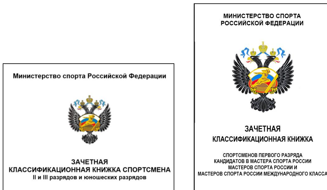
Рис. 3. Зачетная классификационная книжка

Зачетная классификационная книжка выдается один раз при первом присвоении юношеских или второго, или третьего спортивных разрядов и при первом присвоении первого спортивного разряда или КМС.