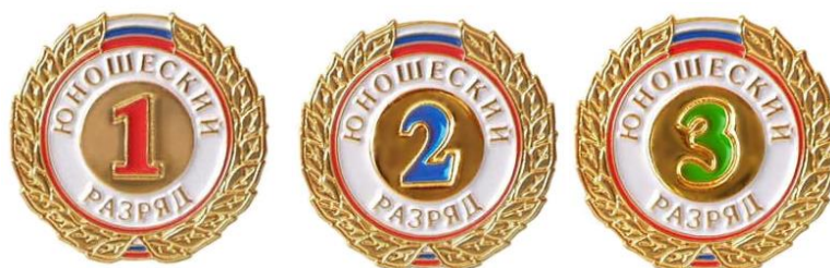
Рис. 2. Нагрудный значок юношеского спортивного разряда