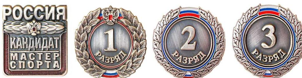
Рис. 1. Нагрудный значок спортивного разряда

Копия документа о принятом решении в течение 5 рабочих дней со дня его подписания направляется в подразделение федерального органа или передается должностному лицу. На официальном сайте органа исполнительной власти, физкультурно-спортивной организации или подразделения федерального органа в информационно-телекоммуникационной сети Интернет копия документа не размещается. При присвоении спортивного разряда организацией выдается нагрудный значок соответствующего спортивного разряда (рис. 1, 2) и зачетная классификационная книжка (рис. 3).